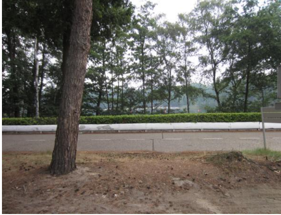
圖(11)核能安全實驗所四周的環境