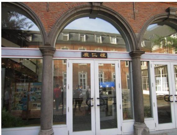
圖(9)魯汶大學中文圖書館