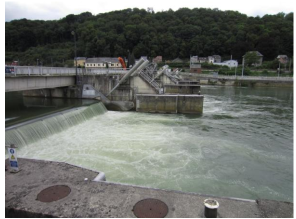
圖(18)馬士河上的水利工程