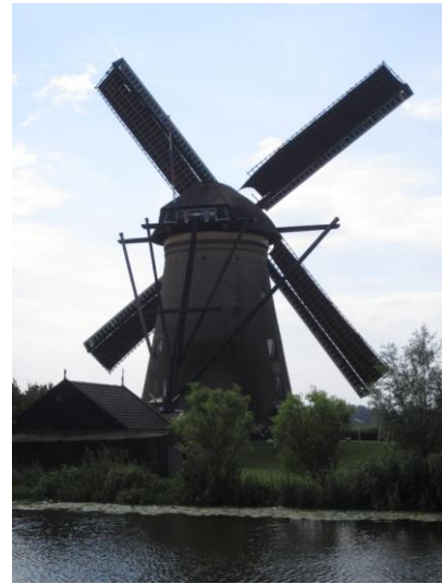
圖(6)小孩子堤防上風車特寫