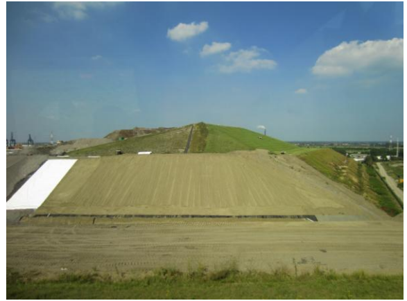
圖(12)安特衛普港旁的垃圾掩埋場