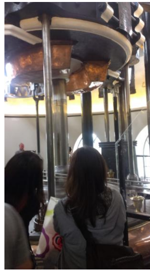
圖(2) 水利博物館幫浦