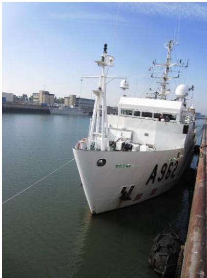
圖(7)布魯日港的研究船