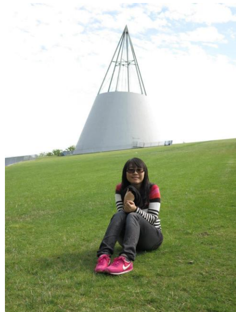
圖(4)Delft 大學圖書館草皮屋頂