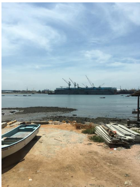
前往制高點眺望港區的途中