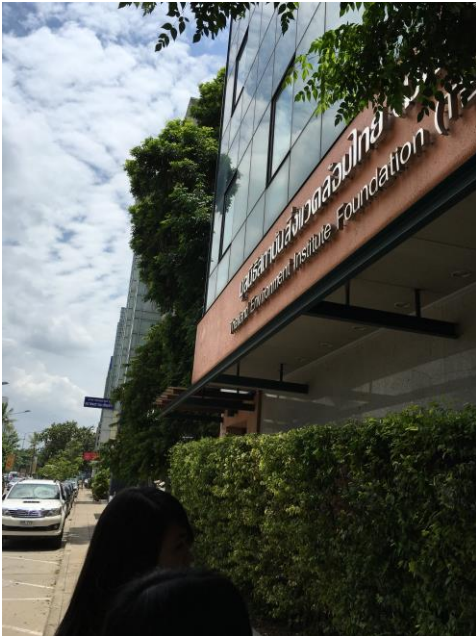
泰國環境基金會外觀