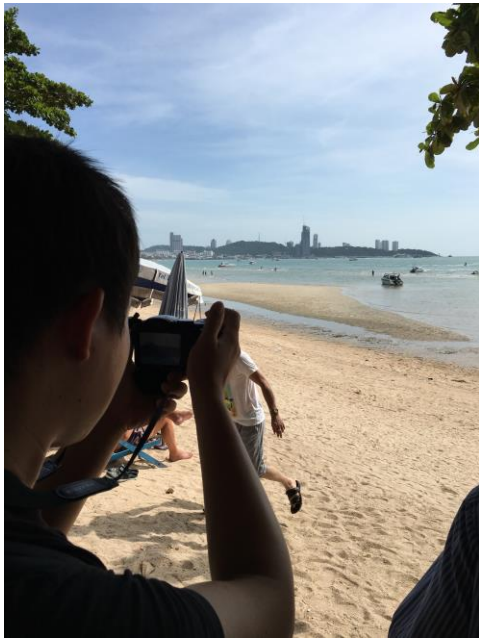
許榮中老師講解沙灘情形