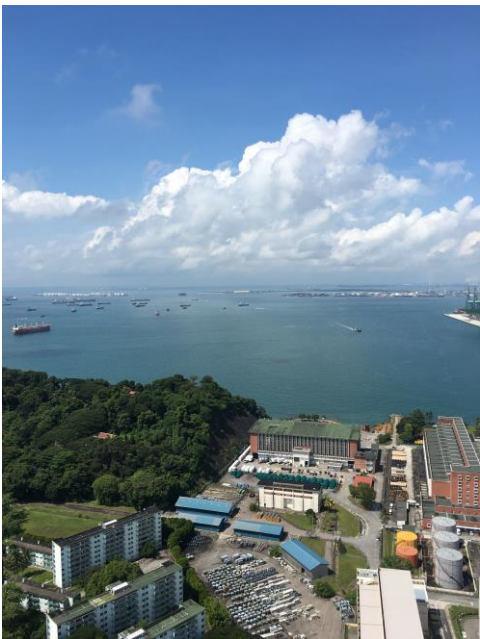
從辦公室看出去停泊港外的船隻