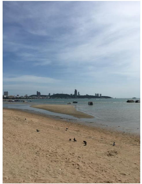
芭達雅沙灘退潮時