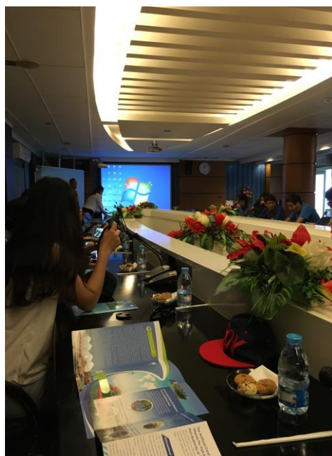
在會議室聽取簡報